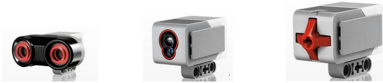
Датчик касания Ультразвуковой датчик Датчик цвета